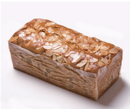
ハンドメイドバターケーキ (大) [フルーツ]