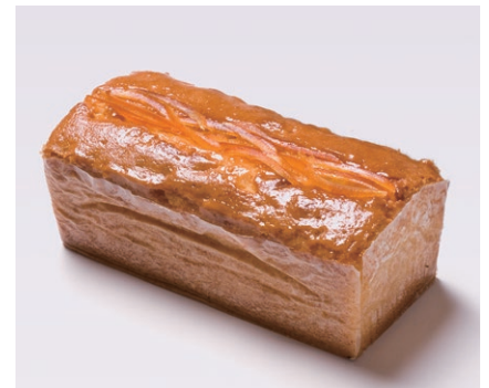
ハンドメイドバターケーキ (大) [オレンジ]