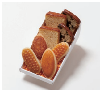
G2-Dセット ¥2,200 (税別)

ミニバターケーキ4枚 (バター、フルーツ 各2枚) ミルレトン 2個 ユーロンパイ 2個