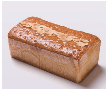
ハンドメイドバターケーキ (大) [アーモンド]