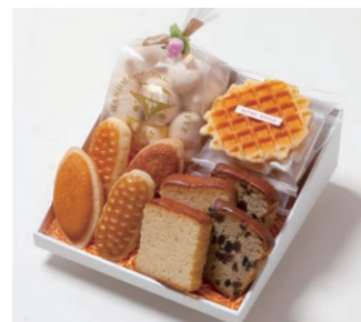
G4-Cセット ¥3,600 (税別)

ミニバターケーキ4枚 (バター、フルーツ 各2枚) ミルレトン 2個 ユーロンパイ 2個 ワッフル5枚 (バター3枚、ココア2枚) 天使のメレンゲ 40g