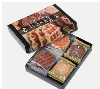
ワッフル&サブレ ¥1,200 (税別)

箱サイズ: W107 × H95 × D125mm ※熨斗 (のし) 対応/不可