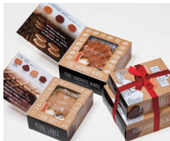
ワッフル&サブレ ¥800 (税別)

サブレ4枚 (バター、ココア、ココナッツ、黒ごまココア各1枚) ワッフル3枚 (バター、ココア、ココナッツ 各1枚)