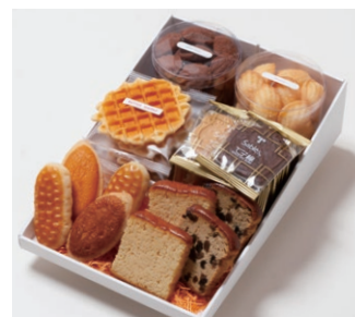
G6-Cセット ¥5,500 (税別)

サブレ10枚 (バター、ココア各3枚、ココナッツ、黒ごまココア各2枚) ワッフル5枚 (バター3枚、ココア2枚) プチマドレーヌ 2個 (バター、チョコ 各120g入り) ミニバターケーキ4枚 (バター、フルーツ 各2枚) ミルレトン 2個 ユーロンパイ 2個