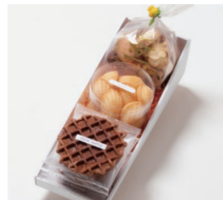
G3-Bセット ¥2,500 (税別)

ワッフル5枚 (バター3枚、ココア2枚) プチマドレーヌ (バター) 120g アソートクッキー 130g