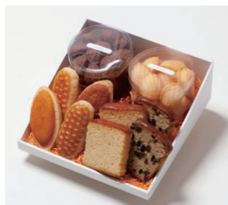
G4-Dセット ¥3,800 (税別)

ミニバターケーキ4枚 (バター、フルーツ 各2枚) ミルレトン 2個 ユーロンパイ 2個 プチマドレーヌ 2個 (バター、チョコ 各120g入り)