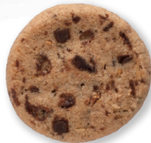
ベネチア スイス産バニラチョコチップを ふだんに使用した アーモンドクッキーです