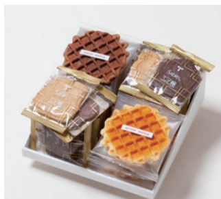
G4-Bセット ¥3,500 (税別)

サブレ20枚 (バター、ココア各6枚、ココナッツ、黒ごまココア各4枚) ワッフル10枚 (バター6枚、ココア4枚)