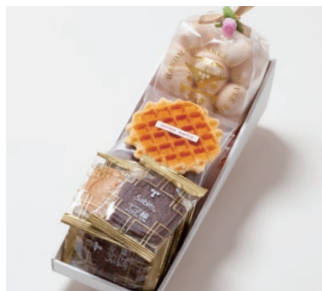
G3-Aセット ¥2,000 (税別)

サブレ8枚 (バター、ココア、ココナッツ、黒ごまココア各2枚) ワッフル4枚 (バター2枚、ココア2枚) 天使のメレンゲ 40g