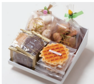
G4-Aセット ¥3,000 (税別)

サブレ10枚 (バター、ココア各3枚、ココナッツ、黒ごまココア各2枚) ワッフル5枚 (バター3枚、ココア2枚) 天使のメレンゲ 40g エスカルゴパイ 80g