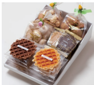
G6-Aセット ¥4,800 (税別)

サブレ10枚 (バター、ココア各3枚、ココナッツ、黒ごまココア各2枚) ワッフル10枚 (バター6枚、ココア4枚) 天使のメレンゲ 40g アソートクッキー 130g エスカルゴパイ 80g