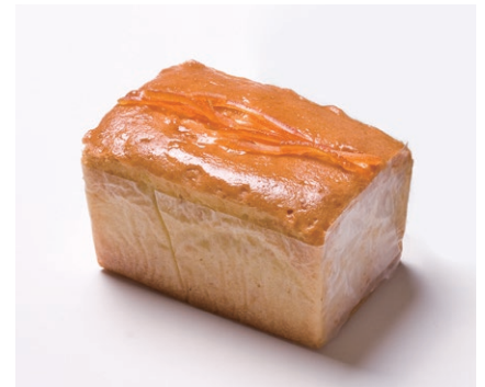
ハンドメイドバターケーキ (小) [オレンジ]