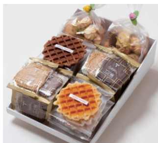
G6-Bセット ¥5,000 (税別)

サブレ20枚 (バター、ココア各6枚、ココナッツ、黒ごまココア各4枚) ワッフル10枚 (バター6枚、ココア4枚) アソートクッキー 130g 2個