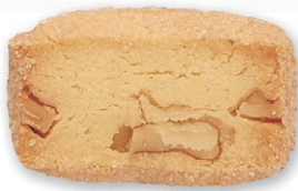
クルミ 香ばしいクルミと生地の食感 があとひくおいしさ