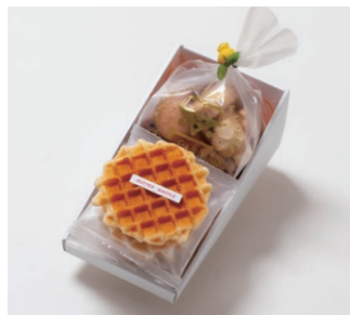
G2-Cセット ¥1,500 (税別)