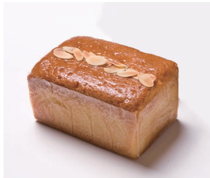
ハンドメイドバターケーキ (小) [アーモンド]