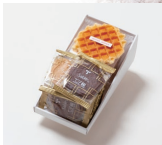
G2-Aセット ¥1,500 (税別)

箱サイズ: W185 × H45 × D245mm ※熨斗 (のし) 対応/不可