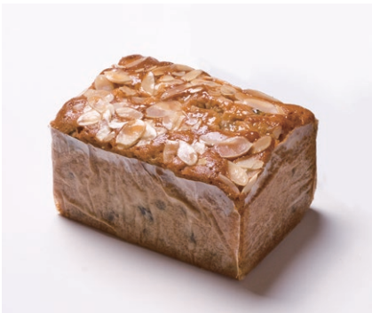
ハンドメイドバターケーキ (小) [フルーツ]