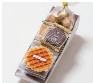
G3-Cセット ¥2,600 (税別)

サブレ10枚 (バター、ココア各3枚、ココナッツ、黒ごまココア各2枚) ワッフル5枚 (バター3枚、ココア2枚) アソートクッキー 130g