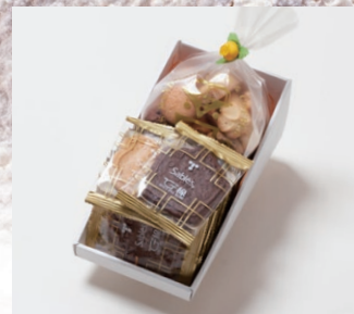
G2-Bセット ¥1,500 (税別)

サブレ8枚 (バター、ココア、ココナッツ、黒ごまココア各2枚) アソートクッキー 130g