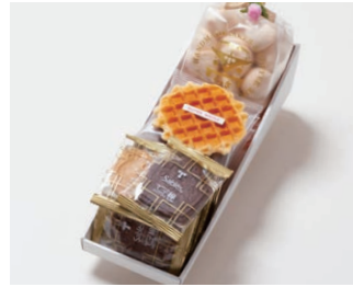
G3-Aセット ¥2,600 (税込 ¥2,808)

サブレ10枚 (バター、ココア各3枚、ココナッツ、黒ごまココア各2枚) ワッフル5枚 (バター3枚、ココア2枚) 天使のメレンゲ 40g