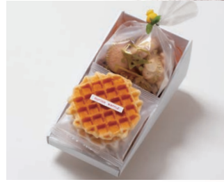
G2-Aセット ¥1,800 (税込 ¥1,944)

箱サイズ: W185 × H45 × D245mm ※熨斗 (のし) 対応/不可