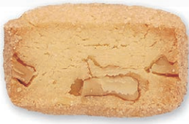
クルミ 香ばしいクルミと生地の食感 があとひくおいしさ