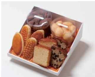
G4-Dセット ¥4,100 (税込 ¥4,428)

ミニバターケーキ4枚 (バター、フルーツ 各2枚) ミルレトン 2個 ユーロンパイ 2個 プチマドレーヌ 2個 (バター、チョコ 各120g入り)