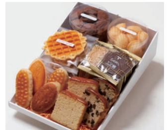
G6-Cセット ¥6,000 (税込 ¥6,480)

サブレ10枚 (バター、ココア各3枚、ココナッツ、黒ごまココア各2枚) ワッフル5枚 (バター3枚、ココア2枚) プチマドレーヌ 2個 (バター、チョコ 各120g入り) ミニバターケーキ4枚 (バター、フルーツ 各2枚) ミルレトン 2個 ユーロンパイ 2個