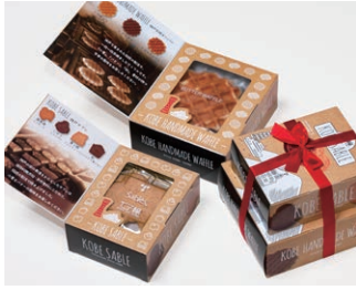
ワッフル&サブレ ¥950 (税込 ¥1,026)

サブレ4枚 (バター、ココア、ココナッツ、黒ごまココア各1枚) ワッフル3枚 (バター、ココア、ココナッツ 各1枚)