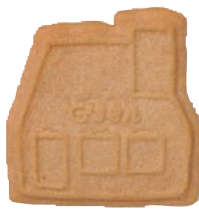
異人館/ココナッツ