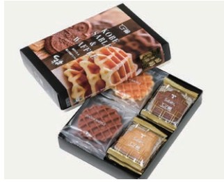
ワッフル&サブレ ¥1,250 (税込 ¥1,350)

箱サイズ: W107 × H95 × D125mm ※熨斗 (のし) 対応/不可