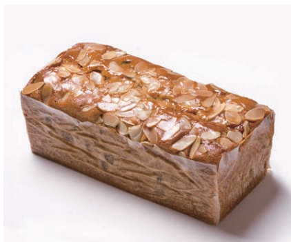
ハンドメイドバターケーキ (大) [フルーツ]