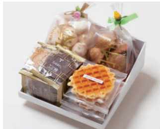
G4-Aセット ¥3,200 (税込 ¥3,456)

サブレ10枚 (バター、ココア各3枚、ココナッツ、黒ごまココア各2枚) ワッフル5枚 (バター3枚、ココア2枚) 天使のメレンゲ 40g エスカルゴパイ 80g