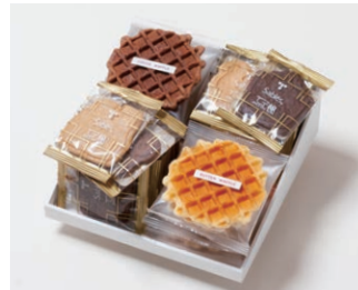
G4-Bセット ¥3,700 (税込 ¥3,996)

サブレ20枚 (バター、ココア各6枚、ココナッツ、黒ごまココア各4枚) ワッフル10枚 (バター6枚、ココア4枚)