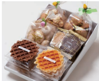
G6-Aセット ¥5,000 (税込 ¥5,400)

サブレ10枚 (バター、ココア各3枚、ココナッツ、黒ごまココア各2枚) ワッフル10枚 (バター6枚、ココア4枚) 天使のメレンゲ 40g アソートクッキー 130g エスカルゴパイ 80g