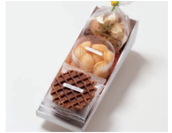
G3-Bセット ¥2,750 (税込 ¥2,970)

ワッフル5枚 (バター3枚、ココア2枚) プチマドレーヌ (バター) 120g アソートクッキー 130g