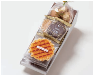
G3-Cセット ¥2,800 (税込 ¥3,024)

サブレ10枚 (バター、ココア各3枚、ココナッツ、黒ごまココア各2枚) ワッフル5枚 (バター3枚、ココア2枚) アソートクッキー 130g