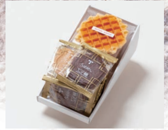
G2-Bセット ¥1,850 (税込 ¥1,998)

サブレ10枚 (バター、ココア各3枚、ココナッツ、黒ごまココア各2枚) ワッフル5枚 (バター3枚、ココア2枚)