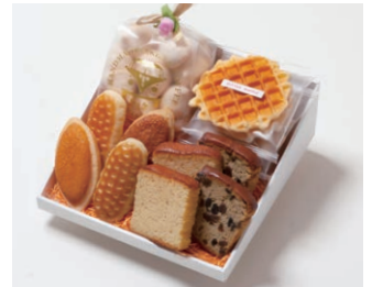
G4-Cセット ¥4,000 (税込 ¥4,320)

ミニバターケーキ4枚 (バター、フルーツ 各2枚) ミルレトン 2個 ユーロンパイ 2個 ワッフル5枚 (バター3枚、ココア2枚) 天使のメレンゲ 40g