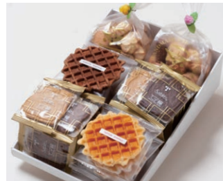
G6-Bセット ¥5,500 (税込 ¥5,940)

サブレ20枚 (バター、ココア各6枚、ココナッツ、黒ごまココア各4枚) ワッフル10枚 (バター6枚、ココア4枚) アソートクッキー 130g 2個