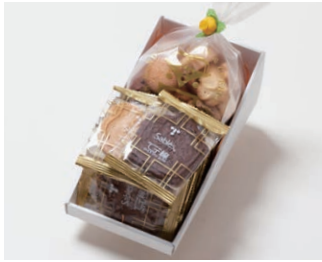
G2-Cセット ¥1,850 (税込 ¥1,998)

サブレ10枚 (バター、ココア各3枚、ココナッツ、黒ごまココア各2枚) アソートクッキー 130g