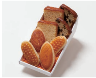
G2-Dセット ¥2,500 (税込 ¥2,700)

ミニバターケーキ4枚 (バター、フルーツ 各2枚) ミルレトン 2個 ユーロンパイ 2個