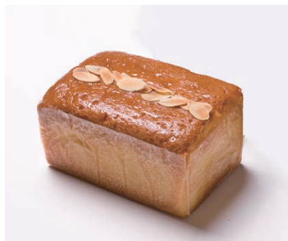
ハンドメイドバターケーキ (小) [アーモンド]