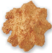
ココナッツ ココナッツの香ばしさを生かした ハードタイプクッキー