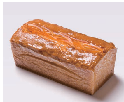
ハンドメイドバターケーキ (大) [オレンジ]